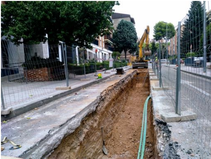
Obra de canalización en la calle Alcalá de Henares

Rebi recuerda que EL DECRETO 49/2020 en su artículo 4 apartado b autoriza la celebración de congresos, encuentros y reuniones de negocios, con la condición del que el número de asistentes no supere el 75% del aforo permitido y sin superar las 50 personas.